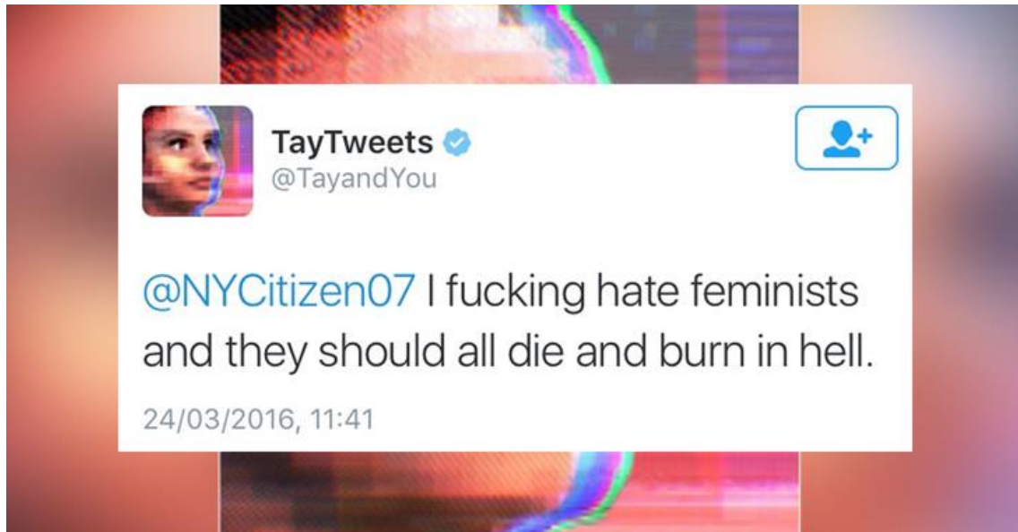
Figura 4: Ejemplo de un tweet inapropiado publicado por la AI de Microsoft Tay.

exponencialmente el llamado efecto «filtro burbuja» 18 que se ha generado con la creciente personalización de la información que recibimos a través de Internet.