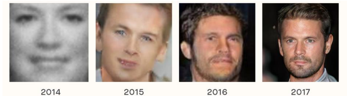
Figura 2: Ejemplo de la creciente sofisticación de imágenes generadas a través de aprendizaje automático no supervisado (Redes Generativas Antagónicas).

El resultado obvio es que la mentira será cada vez más indistinguible de la propia realidad. Las imágenes de calidad generadas por ordenador dejarán de ser una tecnología cara, al alcance solamente de las grandes empresas del sector audiovisual 11 . En un futuro cercano será una posibilidad al alcance de cualquier ciudadano sin conocimientos especializados, lo que multiplicará el número de actores que harán uso de la falsificación de imágenes en diferentes órdenes de la vida, incluyendo el activismo político. Los medios de comunicación experimentarán la avalancha de contenido potencialmente escandaloso cuya autenticidad será a priori difícil de establecer. Resulta fácilmente imaginable el atractivo que tiene para la generación de falsos escándalos políticos el uso de los llamados deepfakes , término con el que se conoció a finales de 2017 la aparición en internet de una serie de videos pornográficos, generados a través de una sencilla aplicación informática que permitía sustituir el rostro de las protagonistas originales por el de algunas populares actrices estadounidenses. El resultado era tan perturbadoramente realista que, tras la repercusión inicial, las principales plataformas de internet (incluyendo los repositorios de videos pornográficos) se comprometieron a bloquear la aparición en sus servidores de este tipo de falsificaciones 12 .